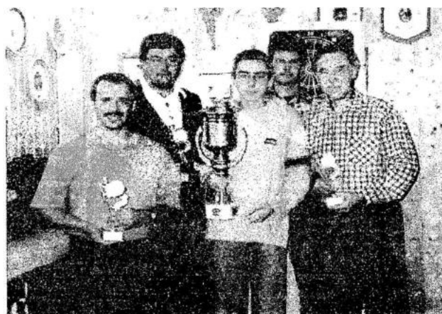
Die Sieger und Ausrichter des VG-Schießen:

Das die anschließende Siegesfeier mit den restlichen Vereinen noch bis in den neuen Tag andauerte und alle Beteiligten sich noch einiges zu erzählen hatten, da man sich in dieser Form doch nur einmal im Jahr sieht, versteht sich fast von selbst.